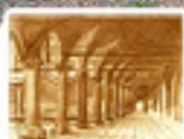
Il Chiostro Circolo Culturale Bologna